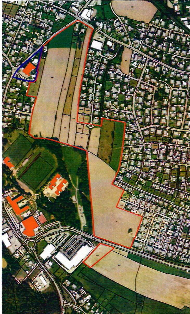
Erweiterung der Vorkaufsrechtssatzung (blau)