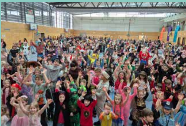
Die Stadthalle in Maxhütte-Haidhof verwandelte sich in einen Spaßpalast!