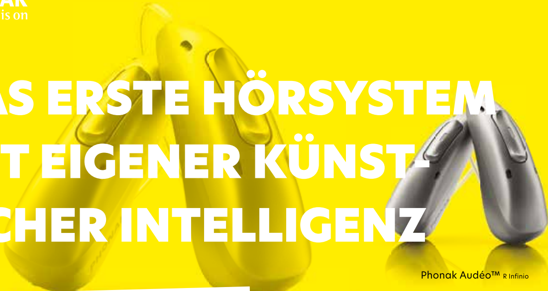
Phonak Audeo™ R Infinio