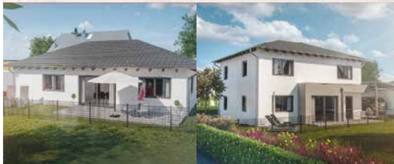
BURGLENGENFELD Bungalow & Einfamilienhaus