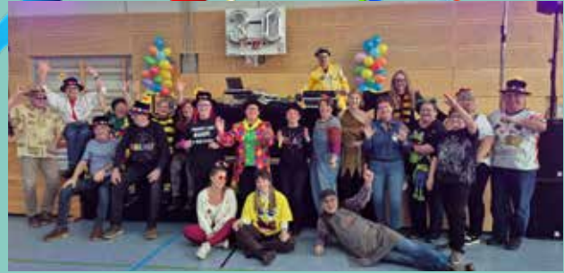
Vielen Dank an die ehrenamtliche Arbeit der Mitglieder des FC Maxhütte-Haidhof und der Frühstücksgruppe HORST zusammen mit den Angestellten aus dem MehrGenerationenHaus, dem Rathaus, der Stadthalle und dem Bauhof sowie der BRK-Bereitschaft Maxhütte-Haidhof.

Text: Rebecca Federer