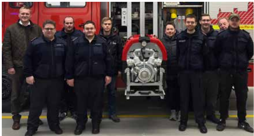
Große Freude herrschte bei der FF Leonberg als die neue Tragkraftspritze übergeben wurde.