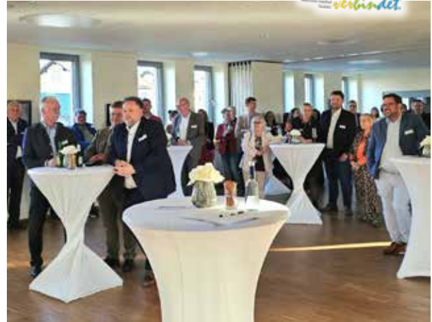
Mit etwa 80 Gästen war das Mehrgenerationenhaus gut gefüllt und schaffte eine lebendige Atmosphäre des Austauschs und der Vernetzung.

Text: Christina Meier, beide Geschäftsstelle Städtedreieck