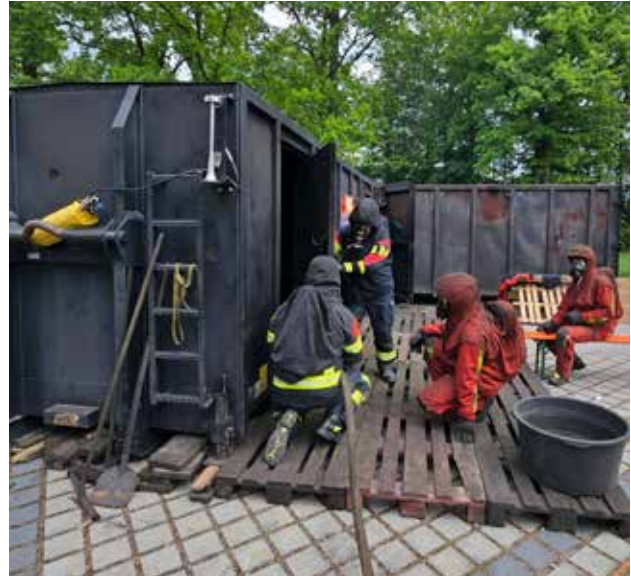
Bei den Übungen wurde den Feuerwehrleuten viel abverlangt.

Wer sich selbst engagieren und Teil einer starken Gemeinschaft werden möchte, ist bei den Feuerwehren im Städtedreieck jederzeit herzlich willkommen – einfach melden und mitmachen!